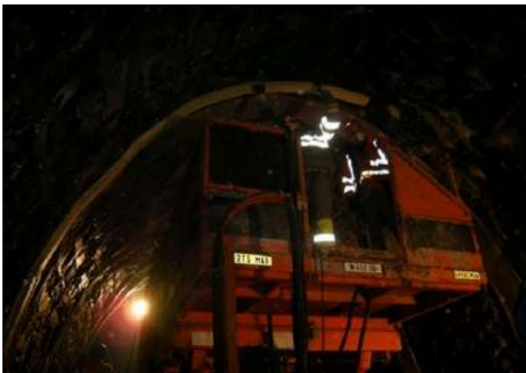
Préparation de la voûte à l'aide de la nacelle télescopique