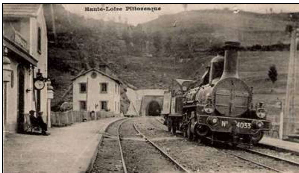
Très belle photo d'époque montrant la gare de Fix Saint Geneys et l'entrée du tunnel