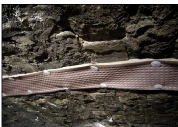
Forages latéraux dans les parois et pose de bandes drainantes