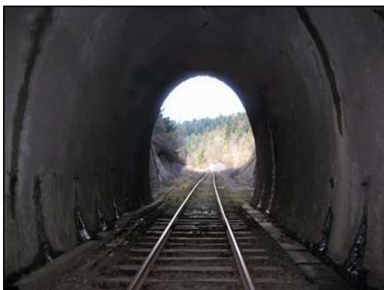
Ci-contre, l'entrée du tunnel vue de l'intérieur avec, au fond, l'ancienne gare de Fix Saint Geneys