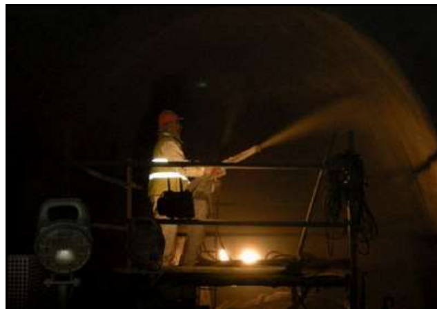
Projection du béton

Le béton pulvérulent est conduit de sa citerne de stockage à un puissant malaxeur qui le mélange, à sec, à des paillettes métalliques. De là, des pompes l'envoient ensuite vers les lances de projection. Ce n'est qu'à l'extrémité de ces lances qu'il est mélangé à l'eau. Sa prise est très rapide.