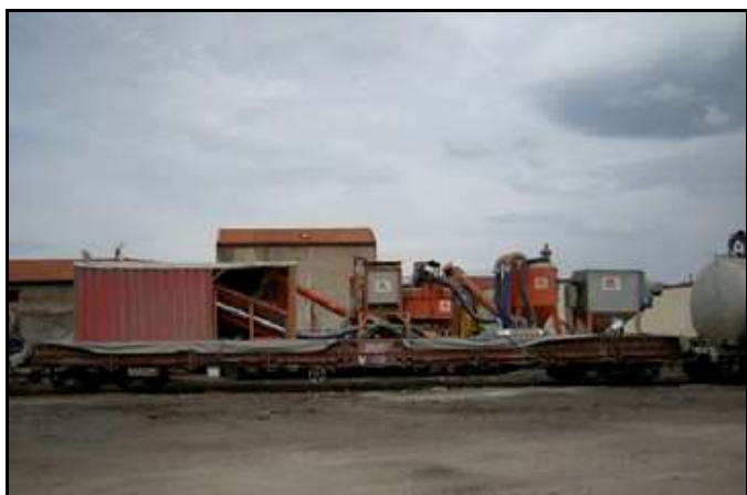
La centrale à béton et son wagon citerne (à droite)

Voici quelques photos de ce chantier d'entretien.