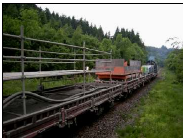
Echafaudages et nacelle télescopique