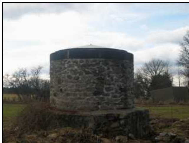
Le débouché de la cheminée, en surface