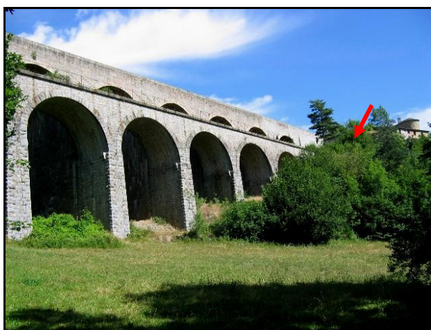
Les deux viaducs accolés : celui de la route à l'arrière-plan, et le ferroviaire au premier plan La sortie du tunnel est juste sous la flèche rouge