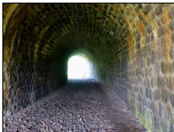
Deux photos de la galerie en regardant vers la sortie et vers l'entrée

Si cette fiche comporte des erreurs ou des oublis, merci de nous le signaler.