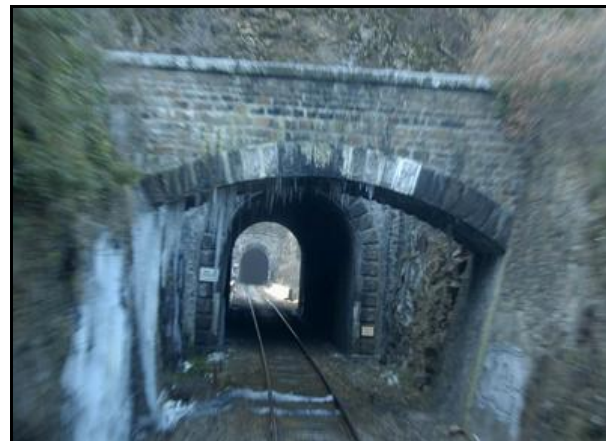
Eté, hiver, le même paysage du pont et de l'entrée du tunnel de Planzol

Si cette fiche comporte des erreurs ou des oublis, merci de nous le signaler.