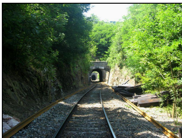
Dans le fond, le tunnel de Chambezon