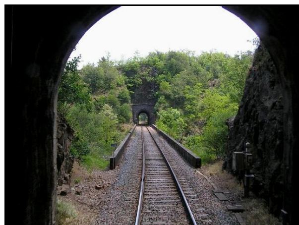
La sortie du tunnel de Planzol vue depuis l'entrée du tunnel de Chambezon