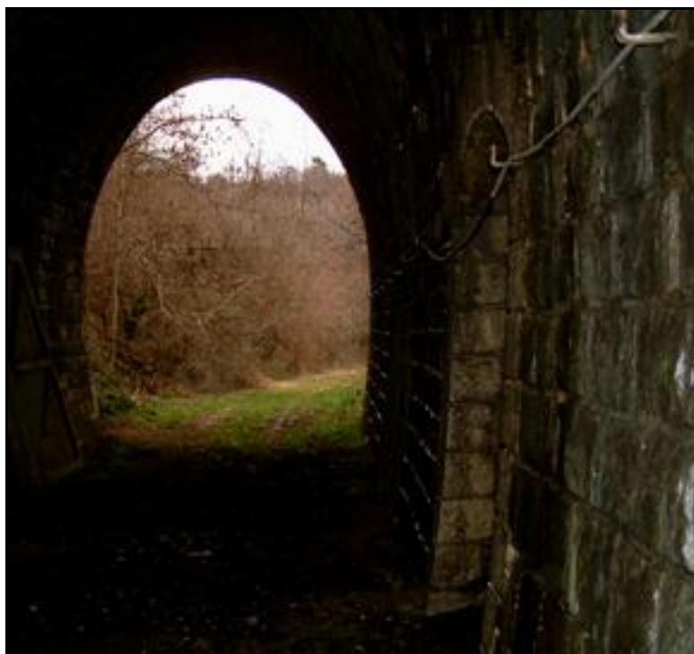
Ci-contre, l'entrée du tunnel vue de l'intérieur, juste avant la porte en retrait qui fermait la fromagerie à l'époque