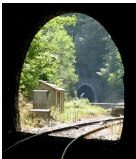
L'entrée du tunnel de Saint Didier vue depuis la sortie du tunnel de Douchanez

Si cette fiche comporte des erreurs ou des oublis, merci de nous le signaler.