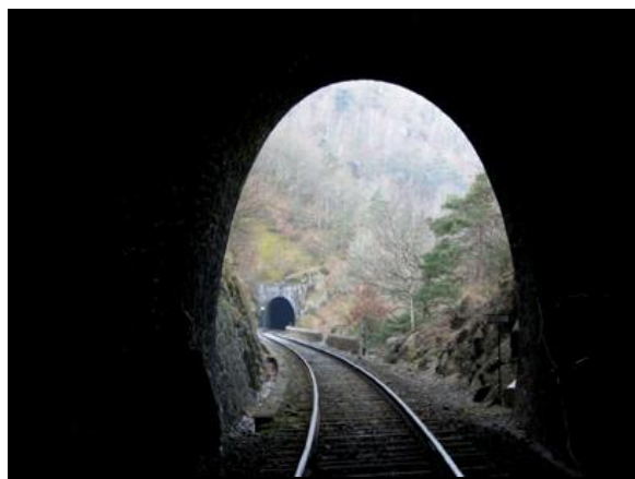
La sortie du tunnel de Jacquet vue depuis l'entrée du tunnel de Douchanez