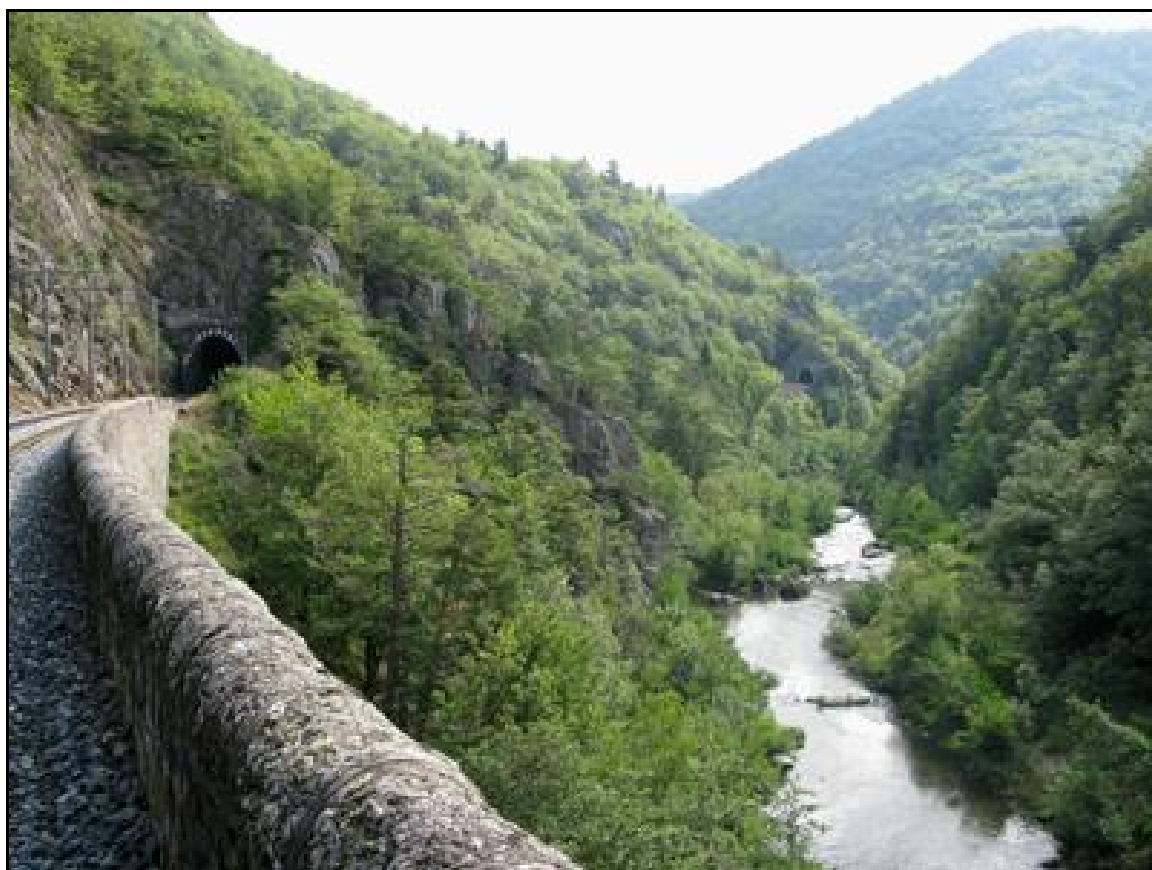
A gauche, la sortie du tunnel de Ramenac, et à droite au fond, celle du tunnel de Faire