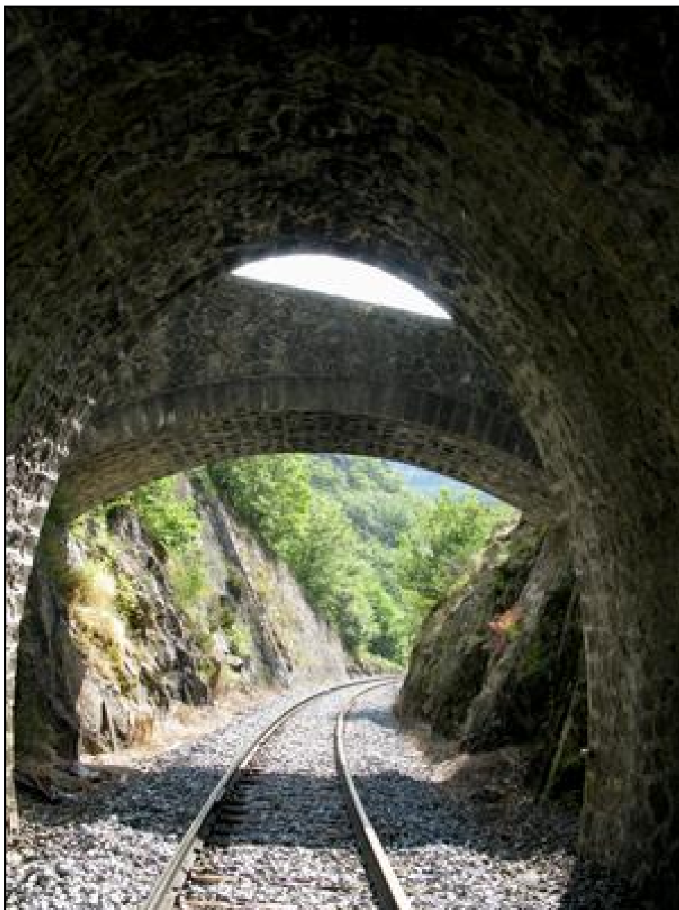
L'entrée du tunnel de Ramenac et l'ancien pont abandonné qui la précède

Si cette fiche comporte des erreurs ou des oublis, merci de nous le signaler.