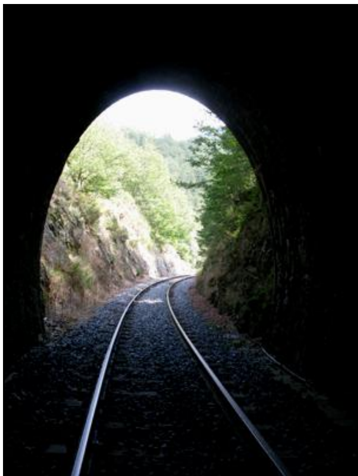
L'entrée vue de l'intérieur

Si cette fiche comporte des erreurs ou des oublis, merci de nous le signaler.