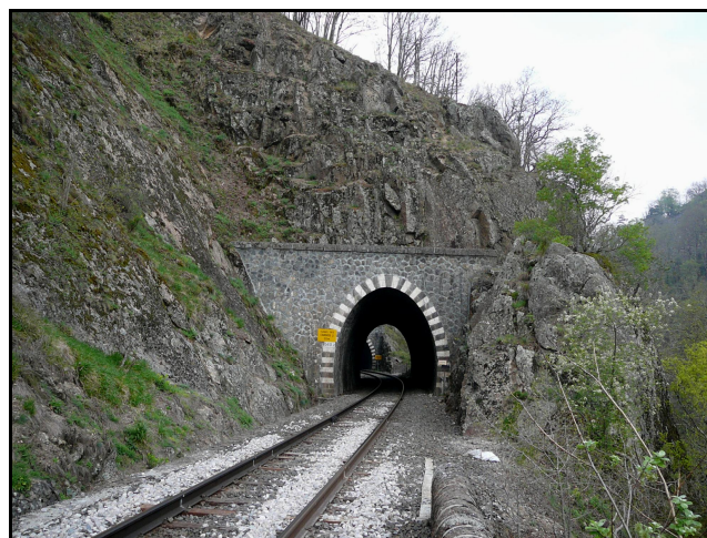
A l'arrière plan, la sortie du tunnel des Ombris n° 1