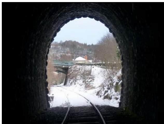
L'entrée et la sortie vues depuis l'intérieur de la galerie

Si cette fiche comporte des erreurs ou des oublis, merci de nous le signaler.