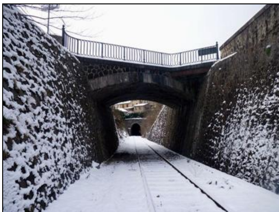
La sortie du tunnel