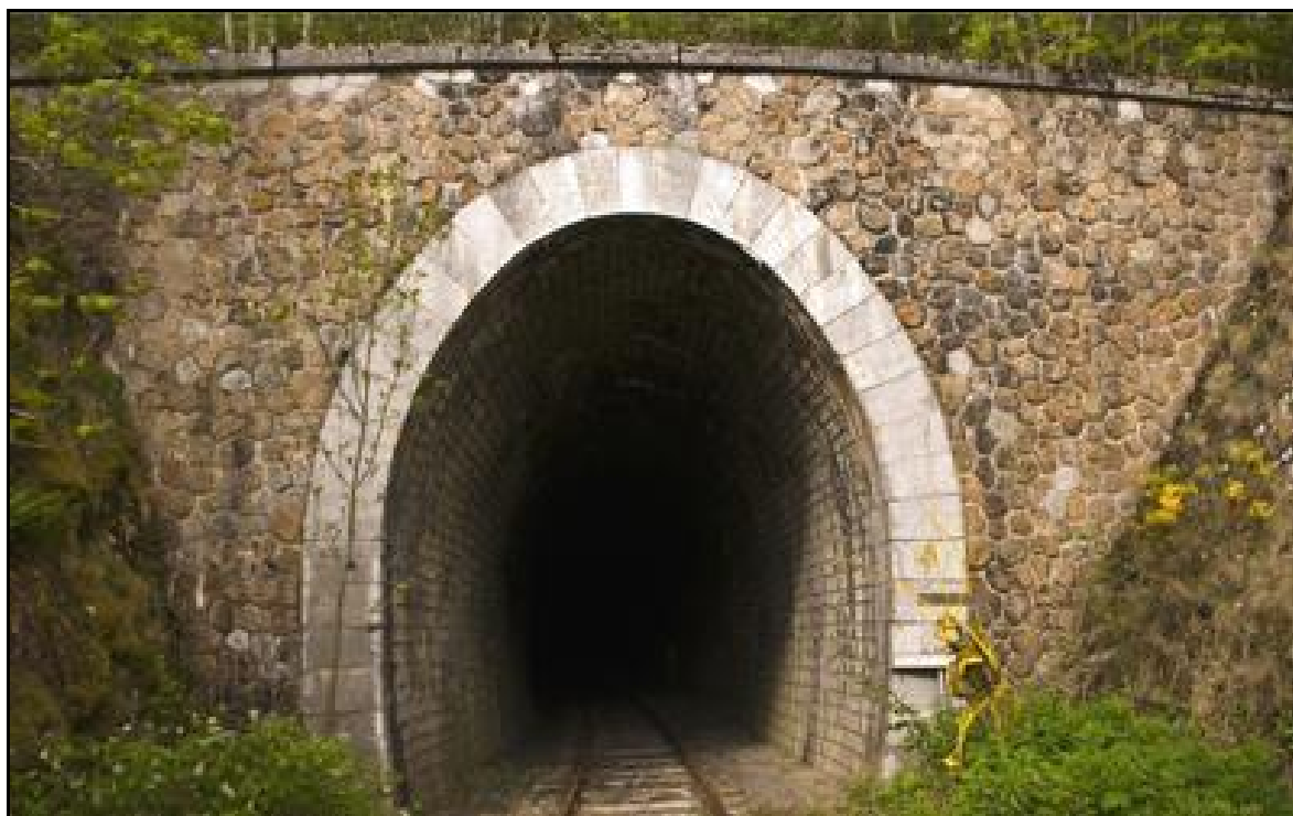
Gros plan sur l'entrée du tunnel de Mazonric