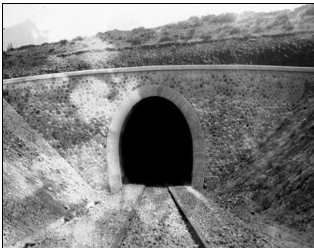
La sortie, peu de temps après la construction du tunnel

Si cette fiche comporte des erreurs ou des oublis, merci de nous le signaler.