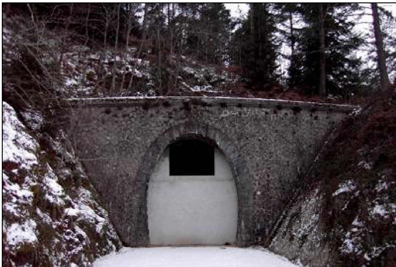
La sortie actuellement murée du tunnel de Sarcenas sous la neige