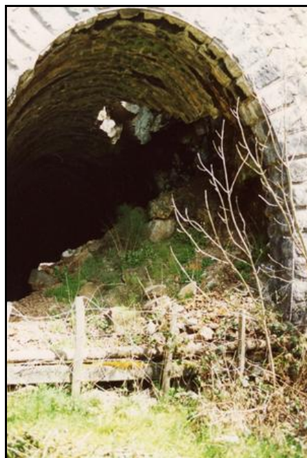
Gros plan sur l'éboulement