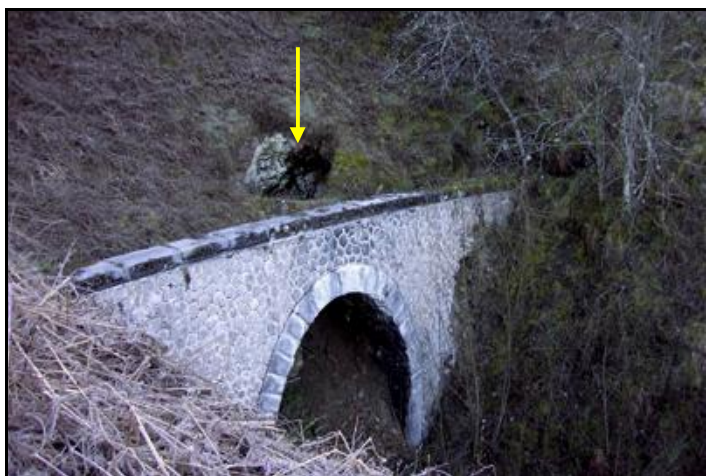
Le fontis en surface, juste au-dessus de la sortie