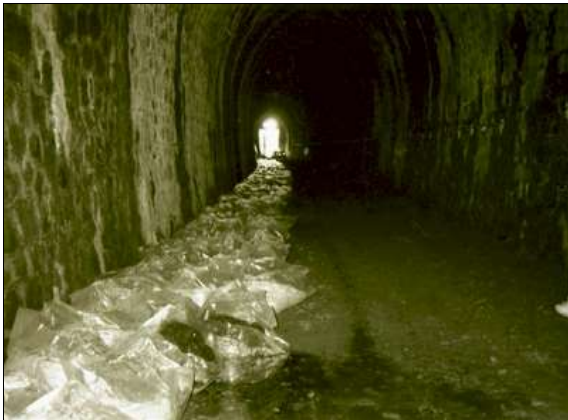
La galerie avec des vestiges de l'ancienne champignonnière