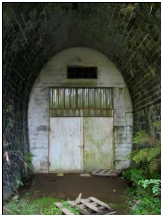
Ci-dessus et ci-dessous, la porte de l'ancienne champignonnière côté entrée et son accès