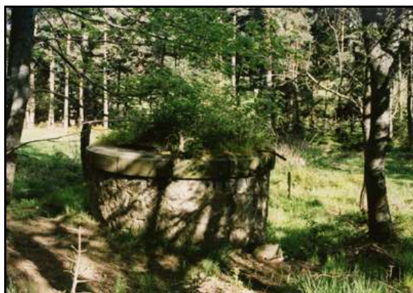
Débouché en surface de l'une des deux cheminées