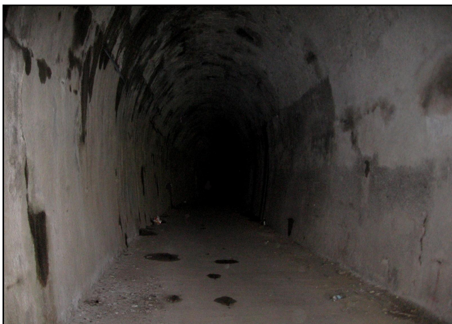
L'intérieur de la galerie

Si cette fiche comporte des erreurs ou des oublis, merci de nous le signaler.