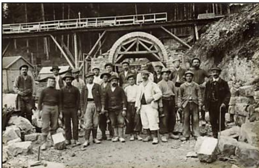
Une équipe d'ouvriers devant la sortie, lors du percement du tunnel Notez la présence de la forêt aujourd'hui complètement disparue

Si cette fiche comporte des erreurs ou des oublis, merci de nous le signaler.