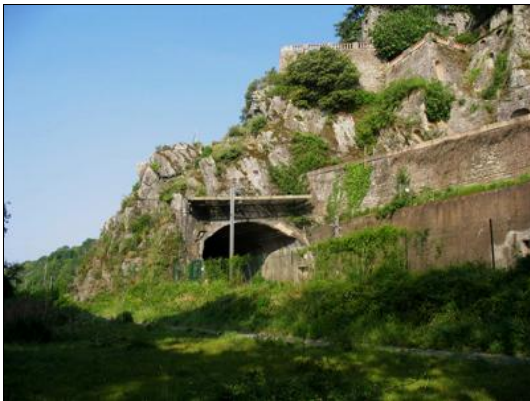
L'entrée du tunnel sous les terrasses du jardin des frères Siffait