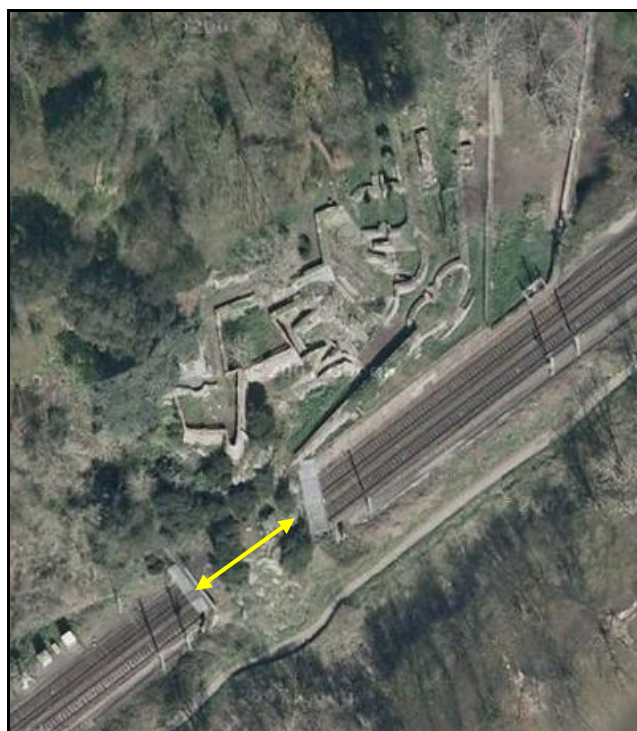
Photo aérienne montrant le tunnel et le jardin en terrasse des Folies Siffait qui le domine

Si cette fiche comporte des erreurs ou des oublis, merci de nous le signaler.