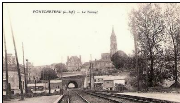
Ci-dessus et ci-dessous, l'entrée du tunnel de Pontchâteau vue de la gare, du temps de la vapeur Sur la photo de gauche, la voie n'est pas encore doublée