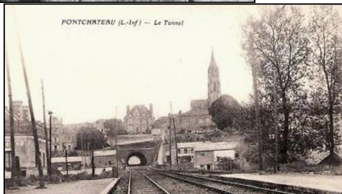
Ci-dessus et ci-dessous, l'entrée du tunnel de Pontchâteau vue de la gare, du temps de la vapeur Sur la photo de gauche, la voie n'est pas encore doublée