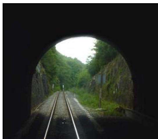
L'entrée et la sortie vues de l'intérieur