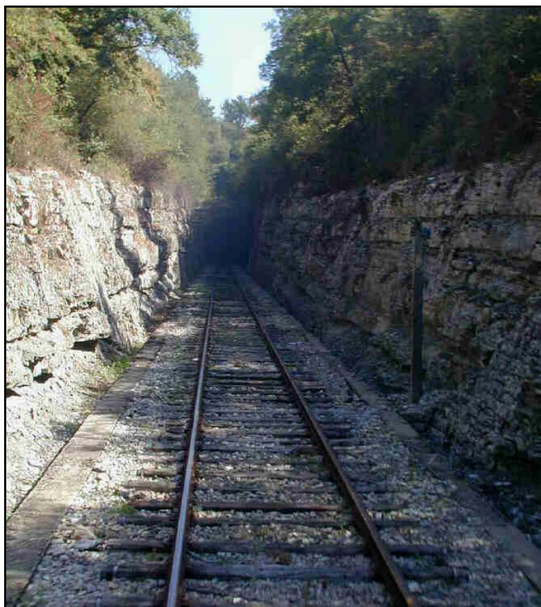
La longue tranchée d'accès à l'entrée du tunnel

Quelqu'un a pris mon visage. Qui prendra mon derrière ?