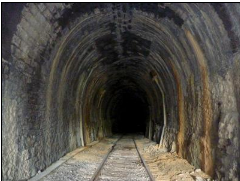
Une zone d'infiltrations avec des sorties d'eau captées

Si cette fiche comporte des erreurs ou des oublis, merci de nous le signaler.