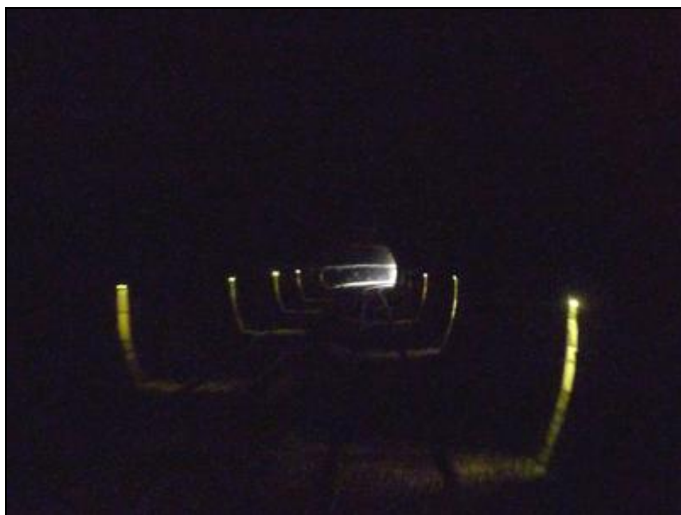
Dans la galerie

Si cette fiche comporte des erreurs ou des oublis, merci de nous le signaler.