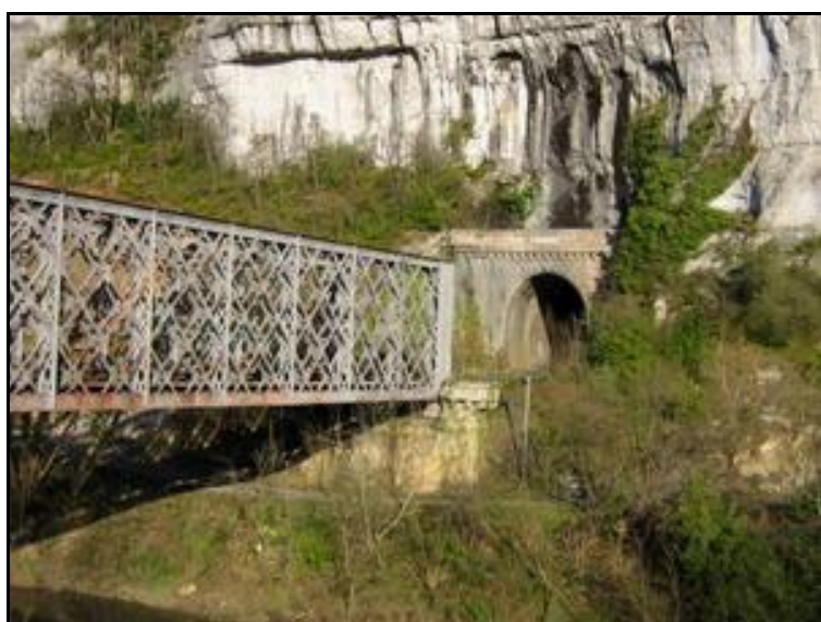
Ci-contre et ci-dessous, l'entrée du tunnel après le pont en treillis métallique