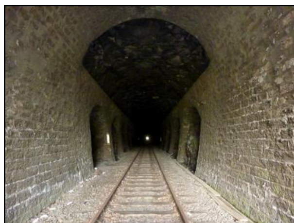
La galerie dont une partie de la voûte est en roche vive

Si cette fiche comporte des erreurs ou des oublis, merci de nous le signaler.