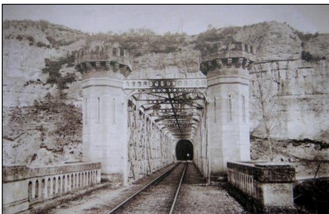
Belle vue d'époque du pont et de l'entrée du tunnel qui montre des pilastres crénelés qui ont aujourd'hui disparu.