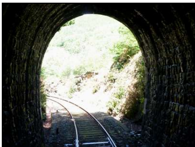
L'entrée vue de l'intérieur