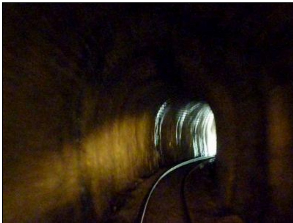
Dans la galerie

Si cette fiche comporte des erreurs ou des oublis, merci de nous le signaler.