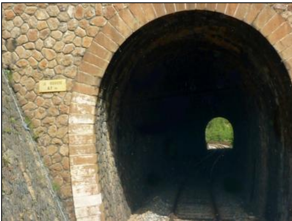
Gros plan sur l'intérieur de la galerie