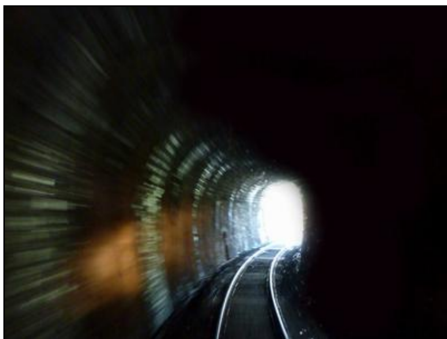
Dans la galerie

Si cette fiche comporte des erreurs ou des oublis, merci de nous le signaler.