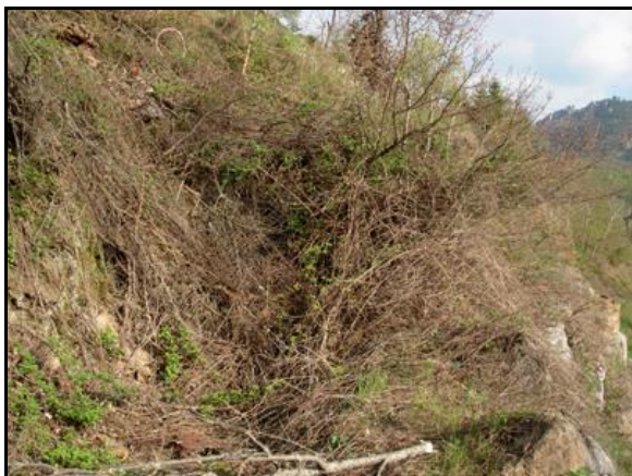
Au-dessus de la route, le creux témoignant de l'ancienne entrée du tunnel