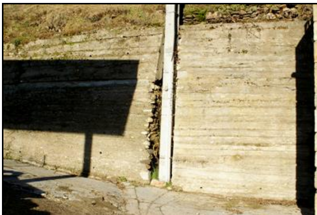
La sortie est derrière ce mur dans une ancienne station service