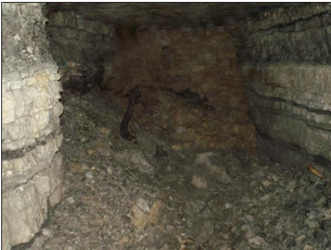
Le mur qui ferme la sortie, lui-même caché à l'extérieur par des déblais accumulés