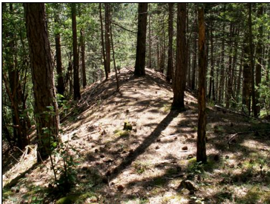
Devant la sortie, l'amorce très nette d'un futur remblai de chemin de fer

Si cette fiche comporte des erreurs ou des oublis, merci de nous le signaler.