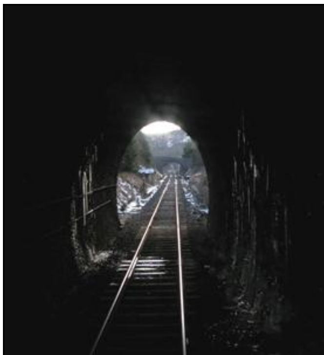
L'entrée du tunnel de Gravel vue de l'intérieur Au fond, la sortie sud du tunnel de Pradal