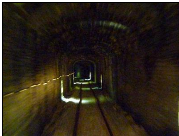
Ci-dessus et ci-dessous, l'intérieur de la galerie