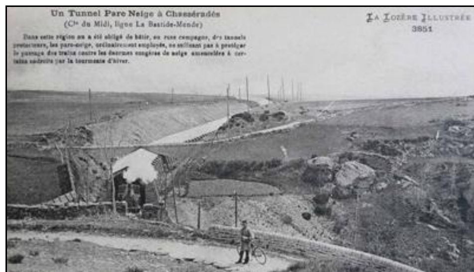
Photo ancienne de l'entrée de la galerie d'où sort un train