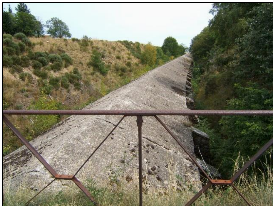
Le toit de la galerie vue du pont qui l'enjambe

Si cette fiche comporte des erreurs ou des oublis, merci de nous le signaler.