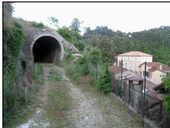
La gare du Collet de Dèze et le tunnel en construction