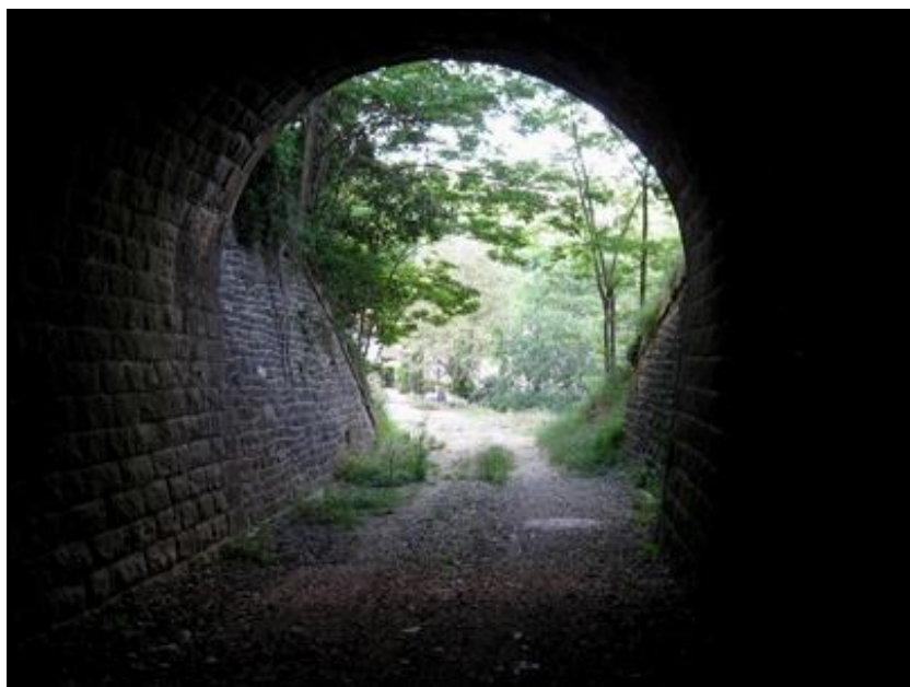
L'entrée du tunnel vue de l'intérieur

Si cette fiche comporte des erreurs ou des oublis, merci de nous le signaler.