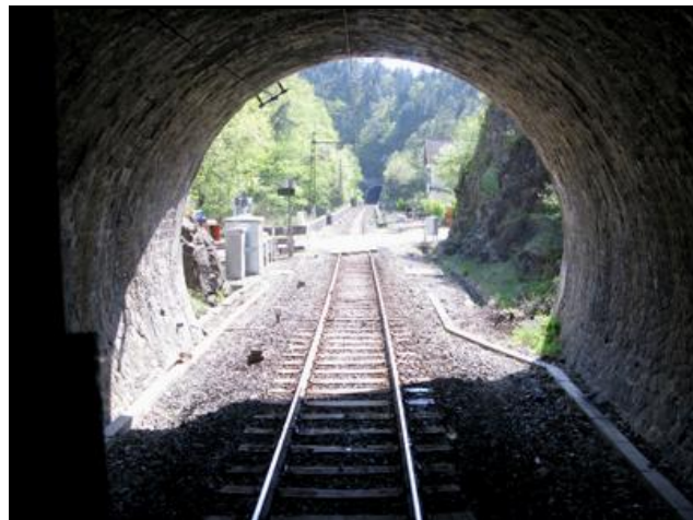
La sortie du court tunnel des Ajustons, suivie du pont sur le Lot avec, tout au fond, de l'entrée du tunnel de Pontilhac