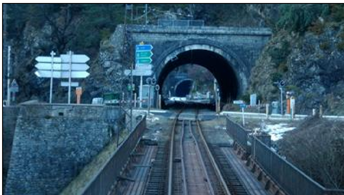
L'entrée du petit tunnel des Ajustons Avec, en arrière-plan, l'entrée du tunnel de Pontilhac