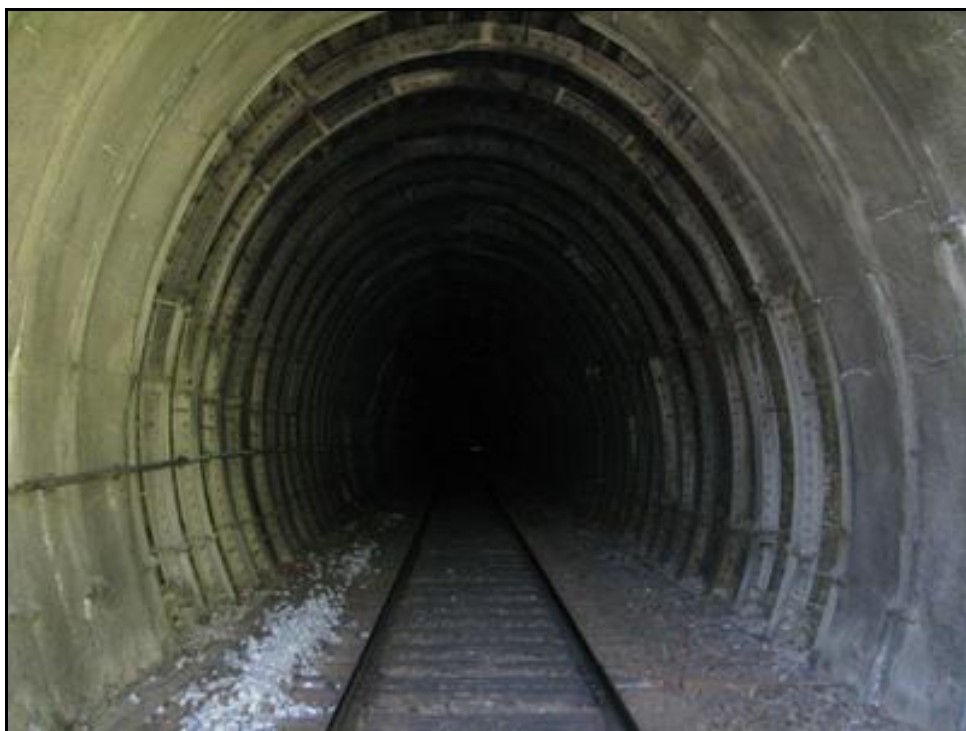
Belle photo prise de l'entrée vers la sortie et montrant le déversement à gauche de la galerie