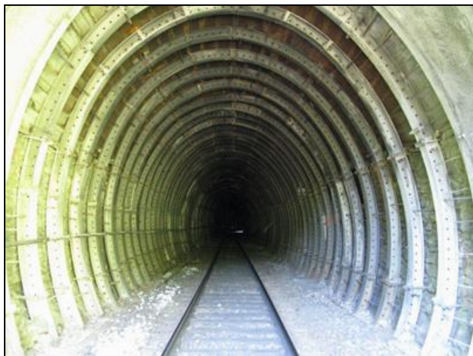
La galerie déformée et cintrée

Si cette fiche comporte des erreurs ou des oublis, merci de nous le signaler.