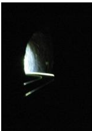
Ci-contre, curieuse photo montrant la courbe en S du tunnel