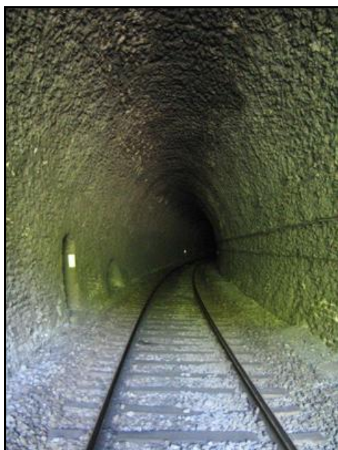
Ci-dessous, drôle de niche