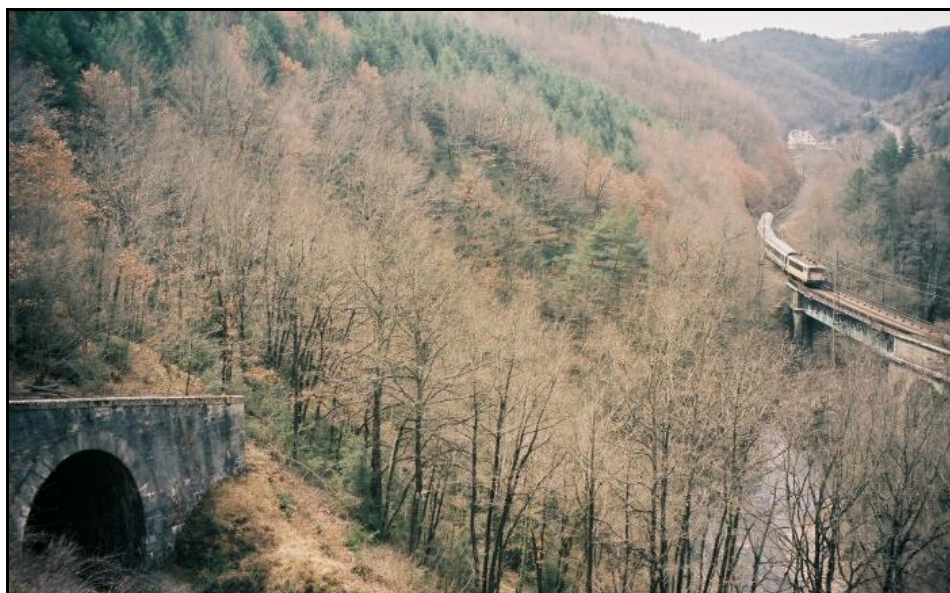
L'entrée du tunnel avec, sur la droite, la ligne des Causses qui file vers Béziers