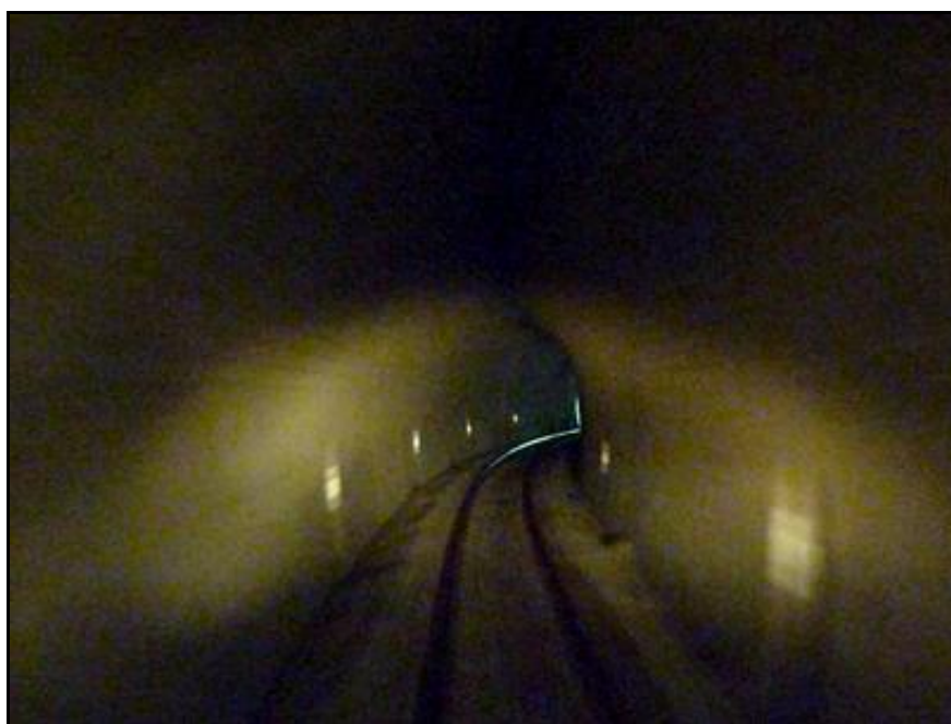
Dans la galerie

Si cette fiche comporte des erreurs ou des oublis, merci de nous le signaler.