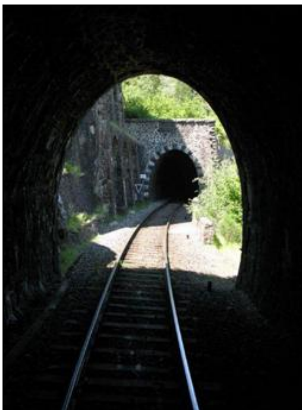
L'entrée de la galerie vue de l'intérieur avec la sortie du tunnel de Crémat