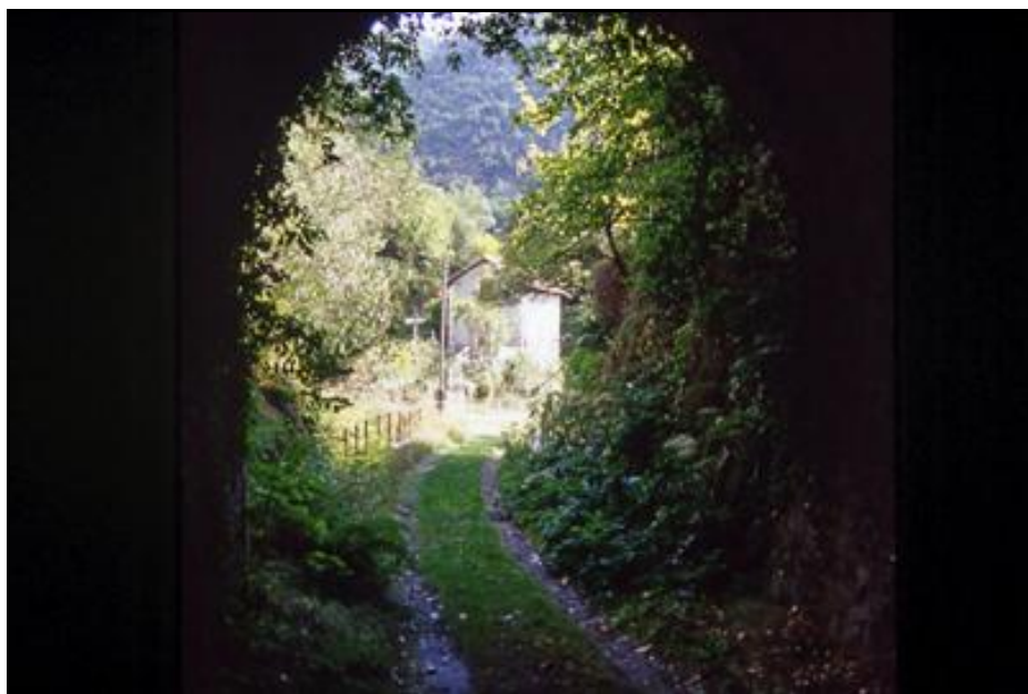
Ci-dessus et ci-dessous, l'entrée du tunnel vue de l'intérieur En haut, avant fermeture En bas, après interdiction d'accès