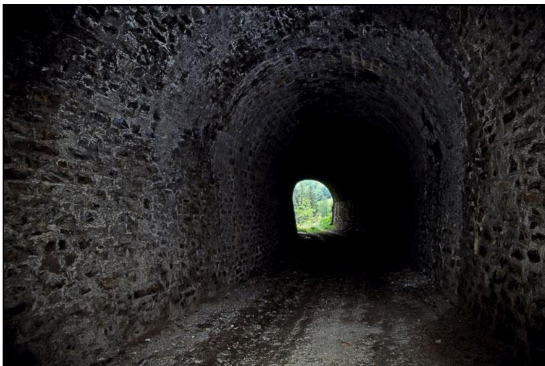
L'intérieur de la galerie en regardant vers l'entrée

Si cette fiche comporte des erreurs ou des oublis, merci de nous le signaler.