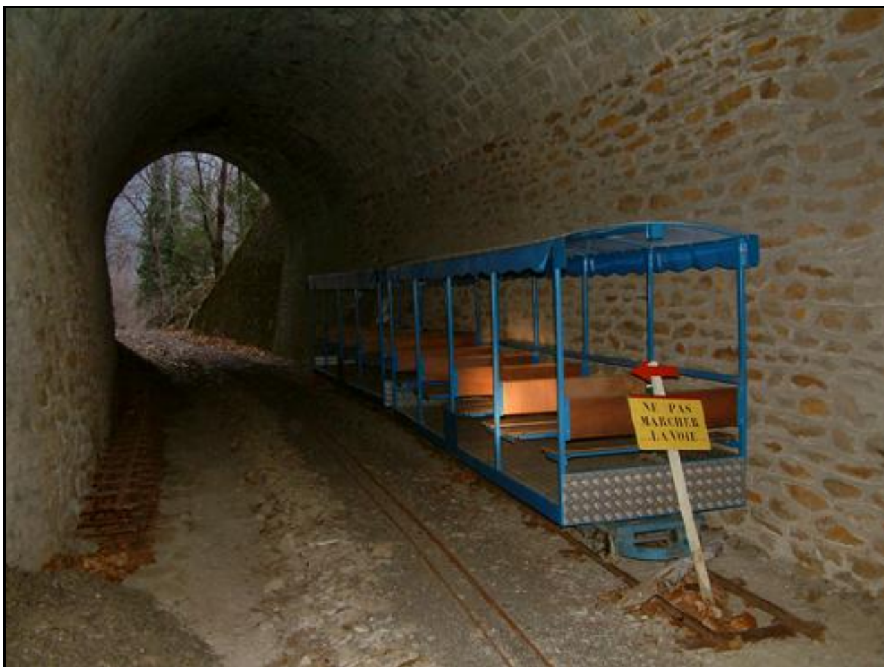
La galerie avec la voie d'un petit train de jardin qui côtoie celle du futur train touristique