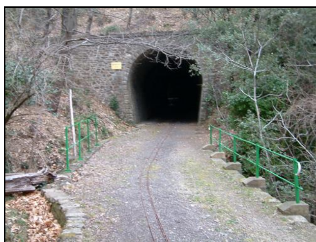
La sortie avec la voie d'un petit train de jardin