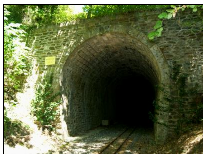
L'entrée et la sortie du tunnel aujourd'hui, avec le train touristique sur voie de 40 cm