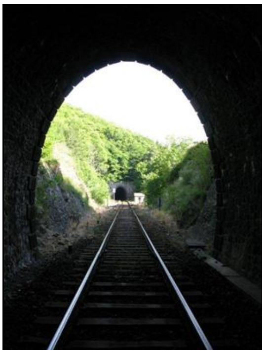
Ci-contre au fond, la sortie du tunnel de Villefort vue depuis l'entrée du tunnel de Rat