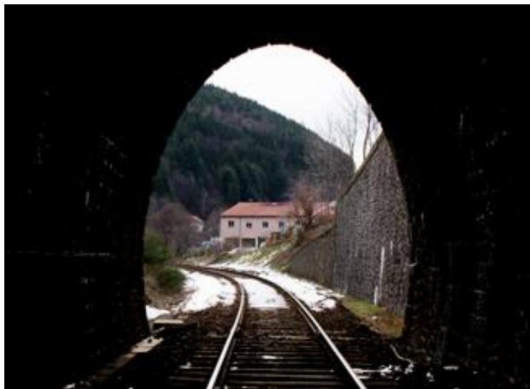
Ci-dessous, la sortie du tunnel de Rat