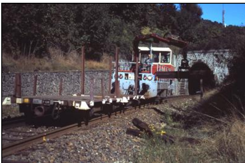
Ci-dessus et ci-dessous, diverses opérations d'entretien à la sortie du tunnel