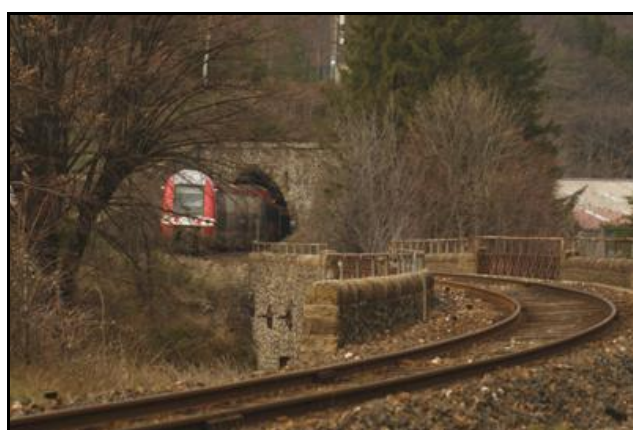
Ci-dessus et ci-dessous, des autorails et train montant d'Alès abordent la sortie du tunnel de Rat