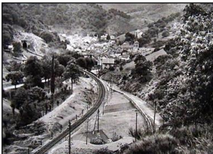
La galerie et la sortie du tunnel de Rat sur une vue ancienne Sur la photo de gauche, au fond, la sortie du tunnel de Villefort