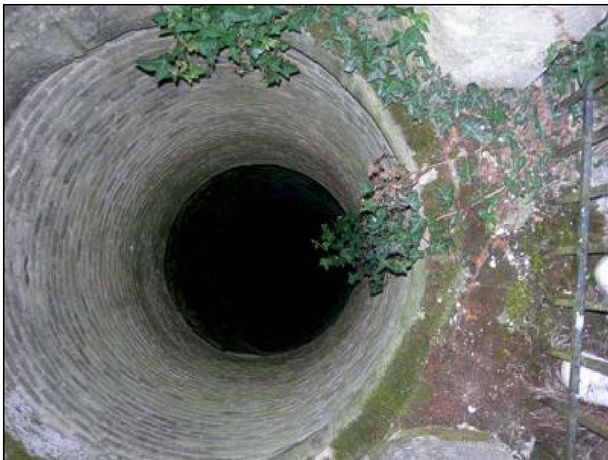
Intérieur de la cheminée n° 2 vue d'en haut. Profondeur : 25 m environ

Si cette fiche comporte des erreurs ou des oublis, merci de nous le signaler.