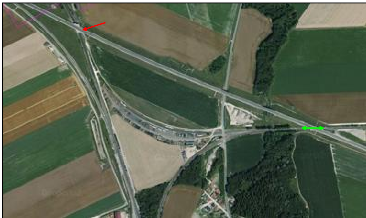
Vue aérienne des galeries des Carelles (flèche rouge) et de la Vesle (flèche verte) sur le nœud de Val Noue

Si cette fiche comporte des erreurs ou des oublis, merci de nous le signaler.