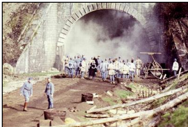
La sortie du tunnel pendant le tournage du film

Ci-contre, la sortie du tunnel aujourd'hui