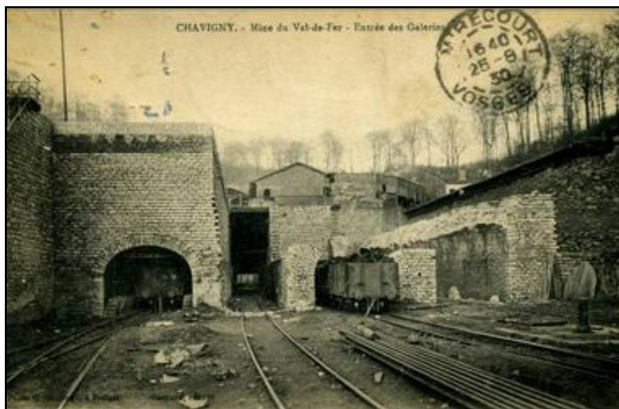
Les entrées des quatre garages ferroviaires souterrains du carreau de mine de Val de Fer De gauche à droite, les souterrains n° 1, 2, 3 et 4, ces deux derniers en cours de destruction