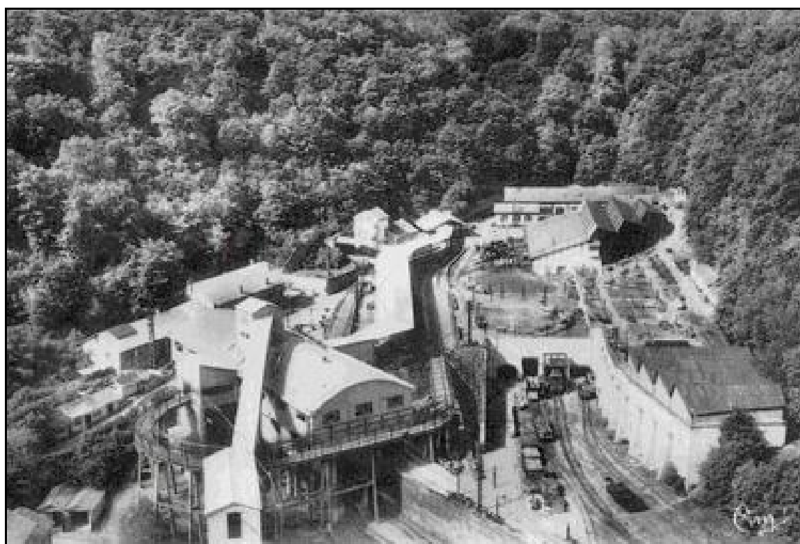
Photo aérienne montrant le carreau de mine de Val de Fer et ses quatre garages ferroviaires souterrains

Si cette fiche comporte des erreurs ou des oublis, merci de nous le signaler.