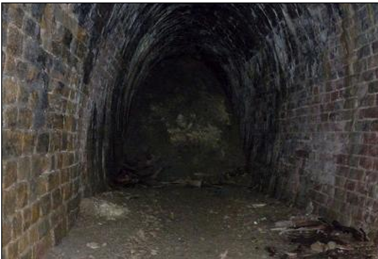
La galerie effondrée et totalement bouchée

Si cette fiche comporte des erreurs ou des oublis, merci de nous le signaler.