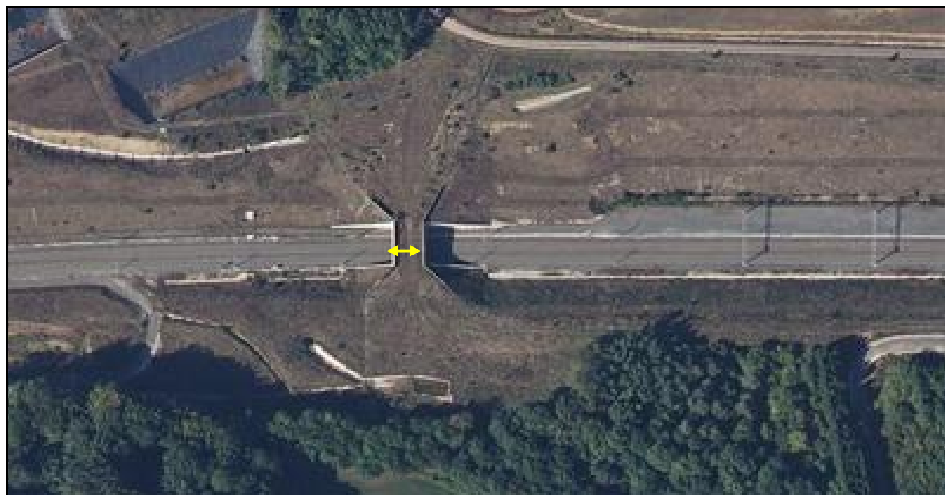
Vue aérienne de la galerie LGV des Abreuvoirs

Si cette fiche comporte des erreurs ou des oublis, merci de nous le signaler.