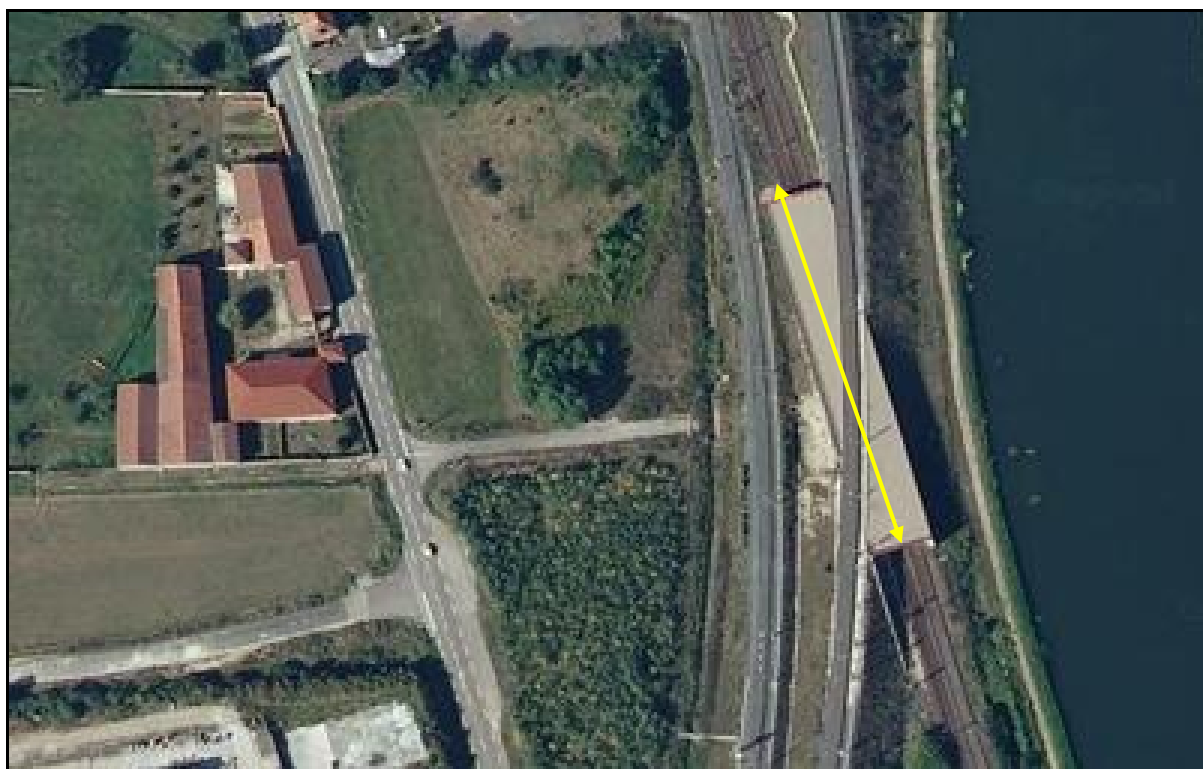
Vue aérienne de la galerie de Moulon

Si cette fiche comporte des erreurs ou des oublis, merci de nous le signaler.