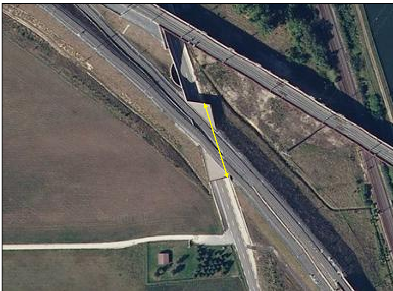
Vue aérienne de la galerie de Vandières

Si cette fiche comporte des erreurs ou des oublis, merci de nous le signaler.