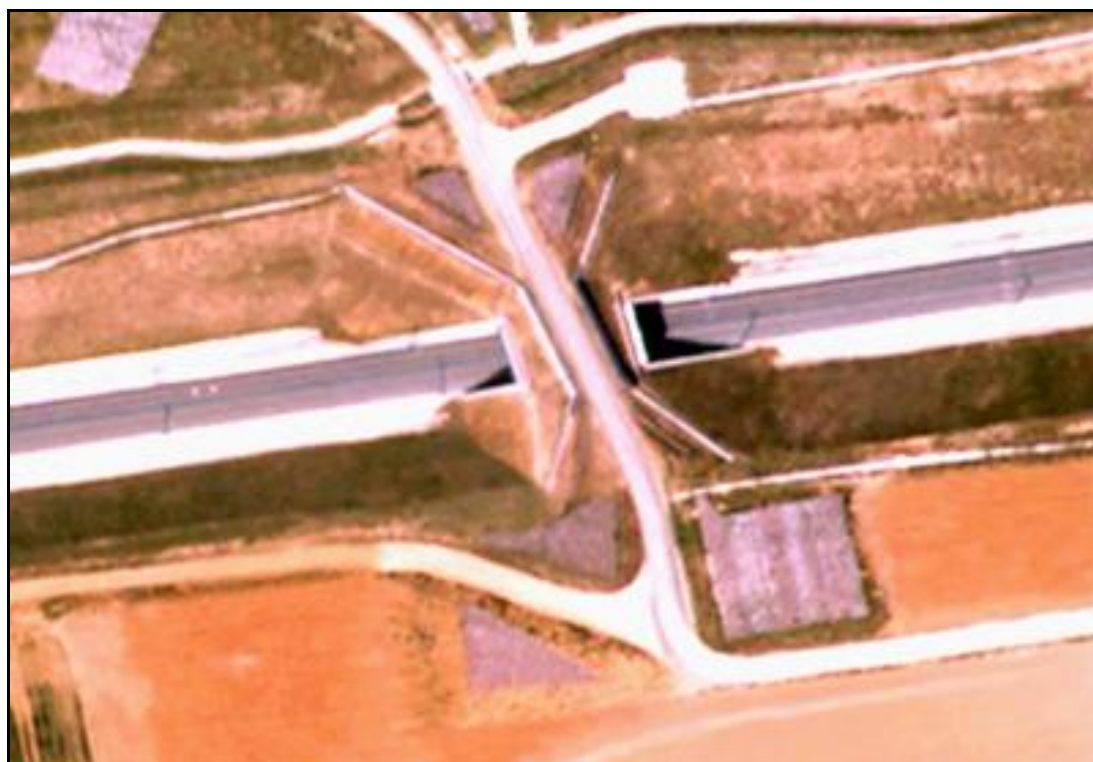
Vue aérienne du faux tunnel des Fonzelles

Si cette fiche comporte des erreurs ou des oublis, merci de nous le signaler.