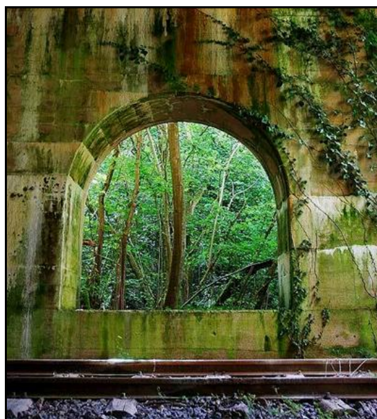
La galerie et gros plan sur une arcade latérale

Si cette fiche comporte des erreurs ou des oublis, merci de nous le signaler.