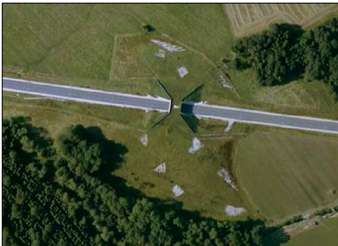
Vue aérienne du faux tunnel de la Carpière

Si cette fiche comporte des erreurs ou des oublis, merci de nous le signaler.