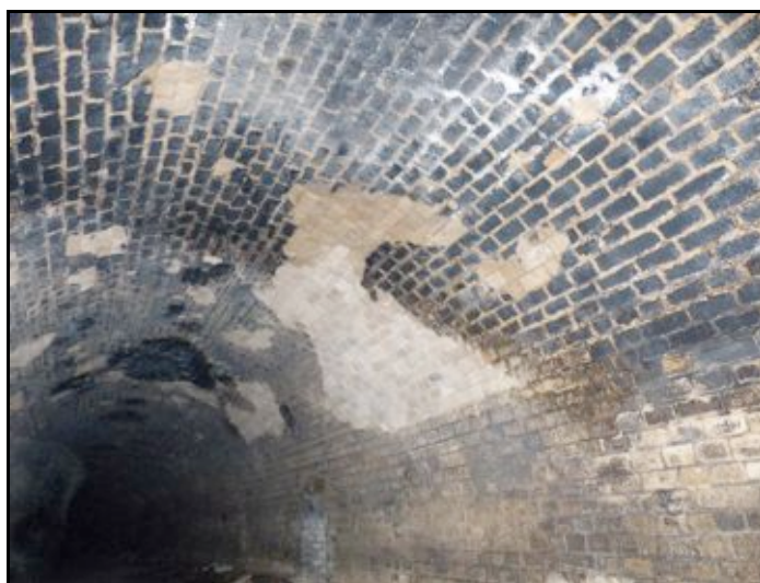
État général de la voûte